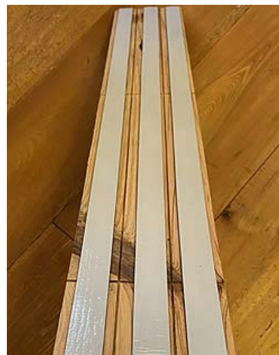
裏面にはテープが貼ってあります。